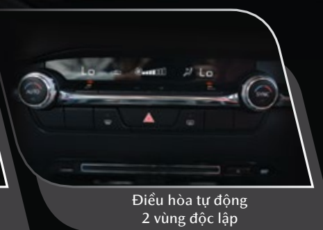
Điều hòa tự động 2 vùng độc lập