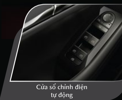
Cửa sổ chỉnh điện tự động