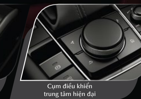
Cụm điều khiển trung tâm hiện đại