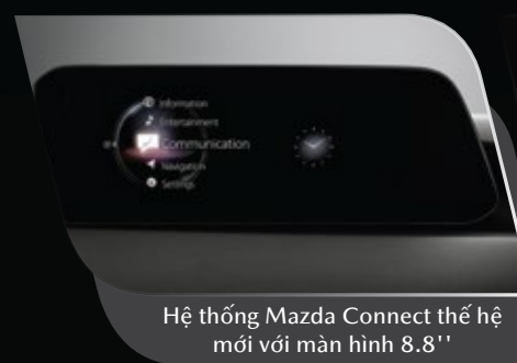
Hệ thống Mazda Connect thế hệ mới với màn hình 8.8"

Màu nội thất đỏ New Red tạo ấn tượng với chất lượng da cao cấp cùng độ sáng ở bề mặt và độ sâu của sắc đỏ.