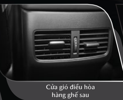
Cửa gió điều hòa hàng ghế sau