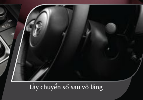
Lấy chuyển số sau vô lăng